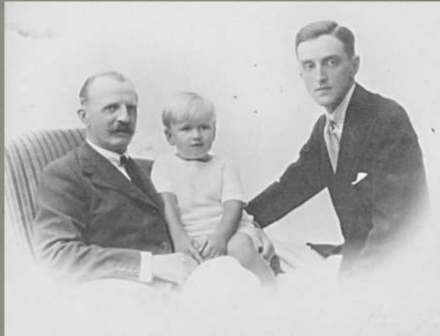
Великий князь Пётр Николаевич с сыном Романом (1896 – 1978) и внуком. Кон. 1920-х гг.