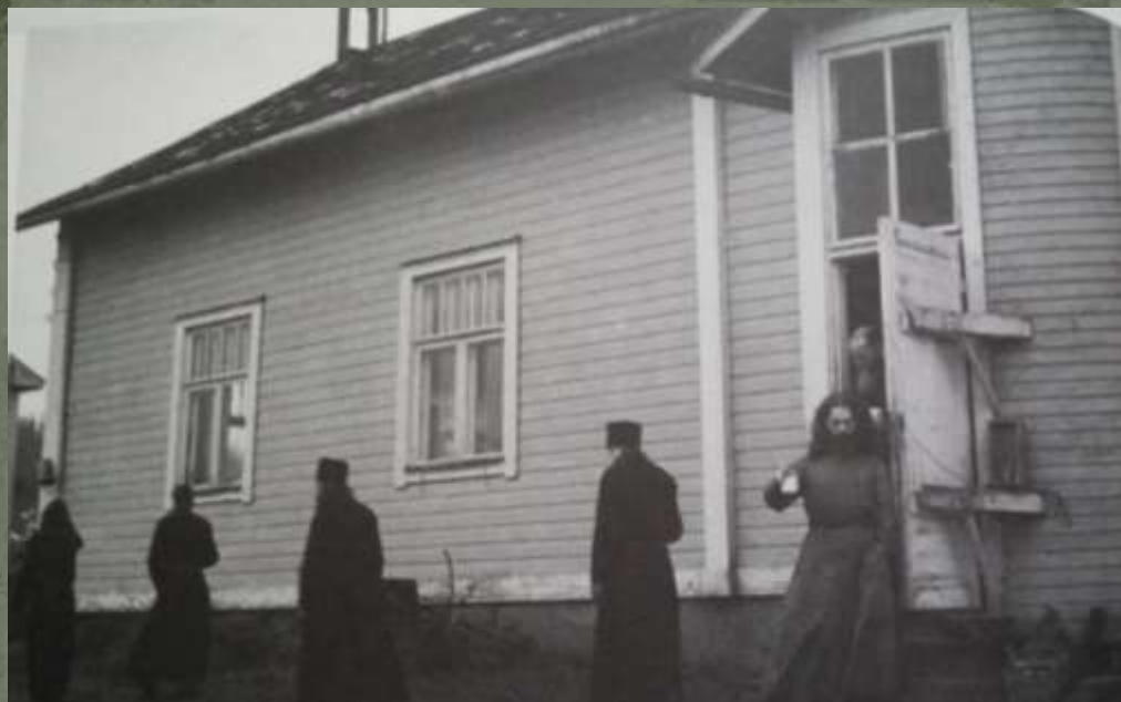
Церковь и братский корпус на Новом Валааме в 1940-х гг.