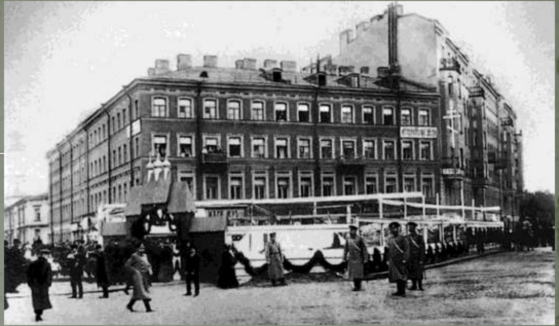
Закладка Николо-Александровского («Барградского») храма на месте Мирликийской часовни в 1913 г. Санкт-Петербург