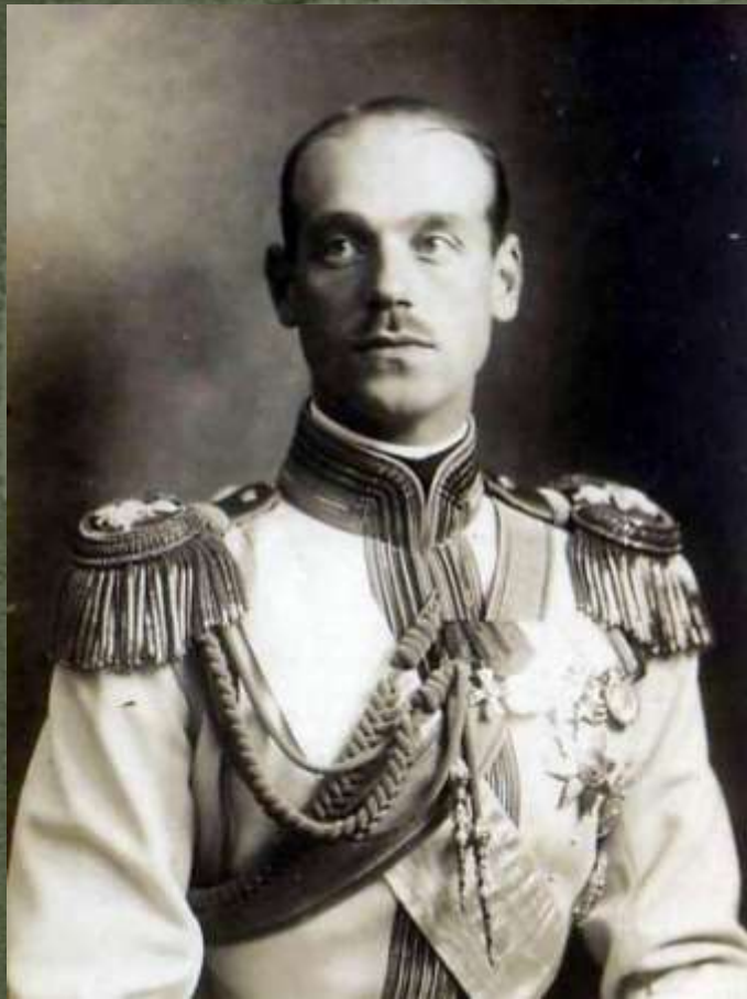
Почетный ктитор Мирликийской часовни вел. кн. Михаил Александрович Романов (брат Императора Николая II)