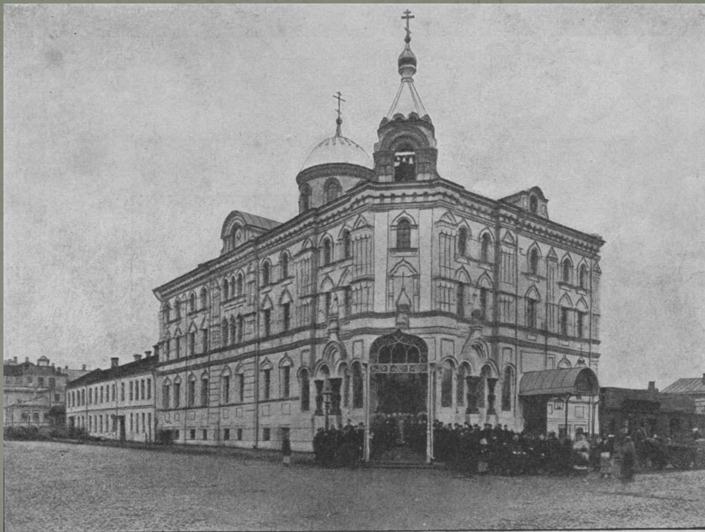
Валаамское подворье, на Тверской-Ямской улицѣ, освященное 18 октября 1901 г.

Спустя два года после рукоположения, в 1901-1903 годах, иеромонах Георгий был направлен в Москву, на строившееся подворье