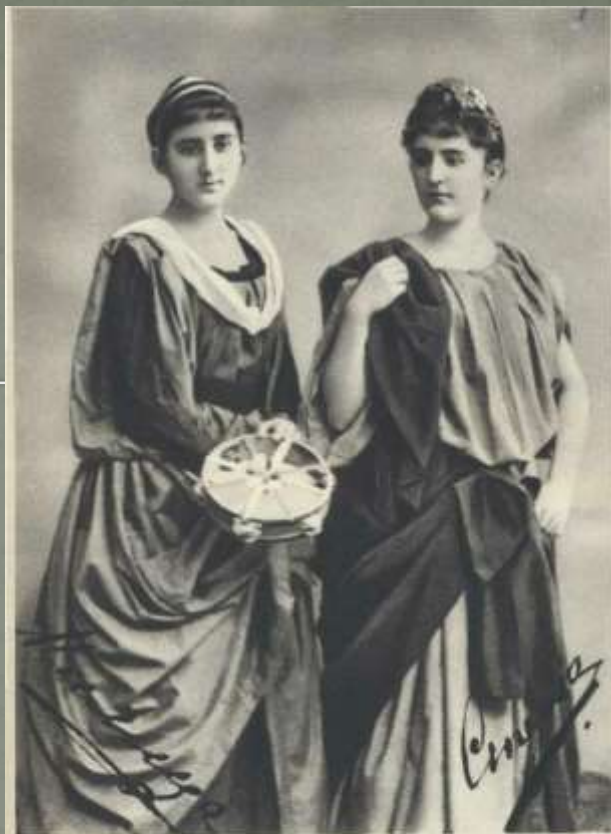
37. Die ‚Montenegrinerinnen‘, Großfürstin Militsa und Anastasia, die Rasputin bei Hof einführten

Великая княгиня Милица Николаевна, супруга вел. кн. Петра Николаевича (1866-1951)