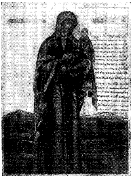
Снимокъ съ обрѣтенной въ 1643 году близъ гор. Выборга «Краснопольской-Тихвинской» иконы Божіей Матери.

(Историческое изслѣдованіе о чудесномъ явленіи Божіей Матери и обрѣтеніи Ея св. иконы въ древнихъ предѣлахъ Православной Церкви въ Финляндіи.)