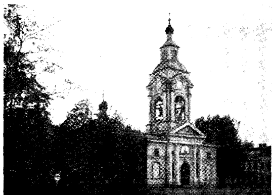
Внѣшній видъ Выборгскаго кафедральнаго собора.

Слѣдующій крупный ремонтъ былъ произведенъ въ 1889 году, когда возникли предположенія, осуществленныя въ 1892 году, объ образованіи особой Финляндской епархіи съ архіепископомъ во главѣ. Тогда былъ расширенъ главный алтарь и устроены боковыя пристройки къ колокольнѣ, придавшія храму его современнѣе видѣ.