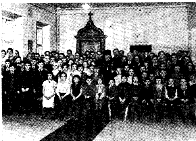
Епископъ Александръ въ Гельсингфорскаго русской народной школѣ.

Въ 13 час. Преосвященный ревизоръ посѣтилъ приходское училище имени Н. И. Табунова, куда къ этому времени собрались также и православные ученики изъ финскихъ и шведскихъ учебныхъ заведеній города Гельсингфорса.