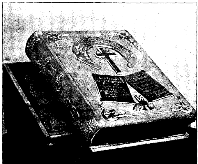
Адресъ Финляндскаго духовенства митрополиту Антонію.

благопоспѣшеніи Вашемъ всегда будетъ первымъ долгомъ нашихъ благодарныхъ сердецъ; просимъ и Васъ, Владыка, молиться о насъ и о чадѣхъ нашихъ. Вѣримъ, Владыка, и, хочется вѣрить, что и въ царственномъ градѣ при своихъ служеніяхъ молитвенно будете поминать и насъ — свою первую паству — и будете для насъ начальникомъ и покровителемъ нашимъ. Пусть въ сердцѣ Вашемъ останется мѣсто для насъ и любви нашей къ Вамъ. Мы хотѣли бы, чтобы эта икона просвѣтителей Финляндіи и ея покровителей, свв. Сергія и Германа, которую просимъ Васъ принять, была знакомъ духовной связи и единенія Вашего съ нами, знакомъ молитвеннаго общенія, на каковое надѣемся и впредь. Выборгъ, 17 января 1899 г. Благодарное и преданное Вашему Высокопреосвященству духовенство Финляндской епархіи.»