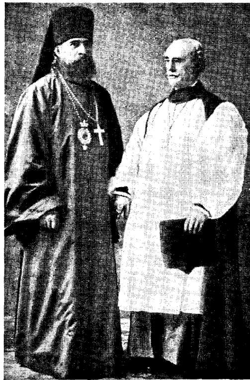
Архiep. Антоній и архiep. Іоркскій Willjam Maclagan, при посѣщеніи Лондона въ 1887 г.

Встрѣченный съ великимъ почетомъ, какъ представитель Россійской Церкви, архіепископъ Антоній за время своего 17-дневнаго пребыванія въ Англіи произвелъ на всѣхъ чарующее впечатлѣніе, многіе поражались просвѣщенностью взглядовъ, его гуманностью, обходительностью и христіанскою терпимостью. Королева отнеслась къ Владыкѣ съ большимъ вниманіемъ на банкетѣ для иностранныхъ представителей 9-го іюня, затѣмъ на пріемѣ въ Лондонѣ 16-го