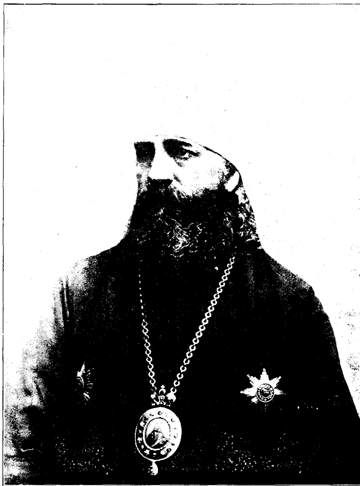
Митрополитъ С.-Петербургскій Антоній.

Въ Царскомъ Селѣ 25-го декабря 1898 года.