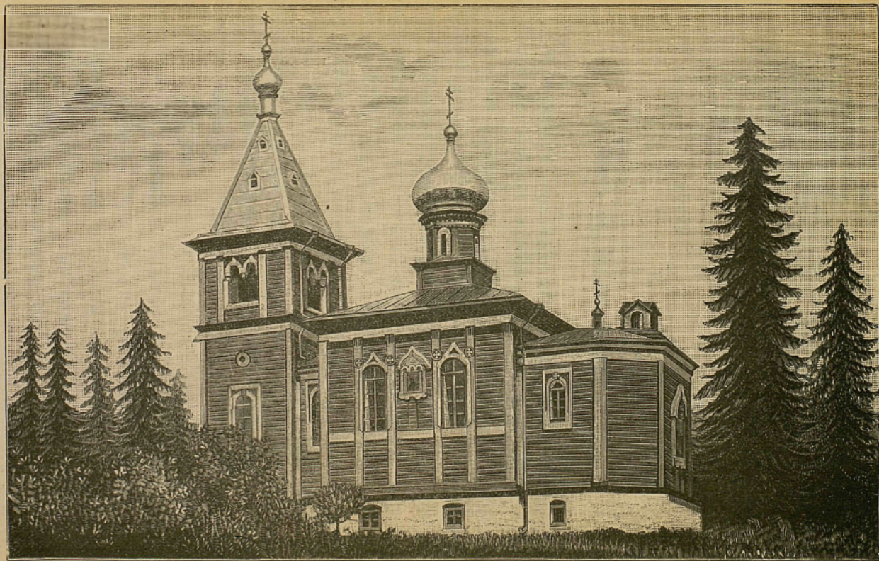
Скитъ св. Пророка Іоанна Предтечи.